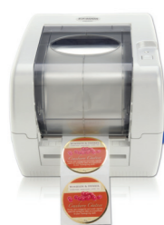
FX400e FOIL IMPRINTER

DX850e distributore di etichette – presenta in modo automatico le etichette autoadesive una alla volta, separandole dal supporto siliconato. Sostituisce il distacco manuale delle etichette, rendendo la linea di produzione più rapida ed efficiente.