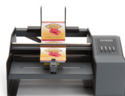
DX850e LABEL DISPENSER

Serie AP applicatori di etichette – sono la soluzione semi-automatica perfetta per l'etichettatura di contenitori cilindrici così come di molti contenitori affusolati incluse bottiglie, lattine, barattoli e tubi.