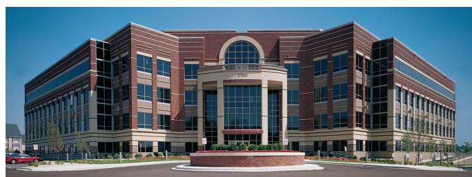
Primera Technology, Inc. USA