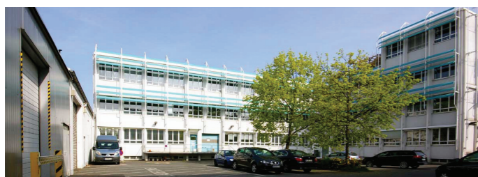
Primera Technology Europe, Germania

Primera Technology è uno dei principali produttori al mondo di stampanti speciali. Abbiamo costruito ben oltre un milione di stampanti inkjet e a trasferimento termico durante la nostra storia. Le stampanti a colori di Primera assicurano anni di affidabilità. Soprattutto, la LX900e è in grado di dare risultati professionali a prezzi convenienti!